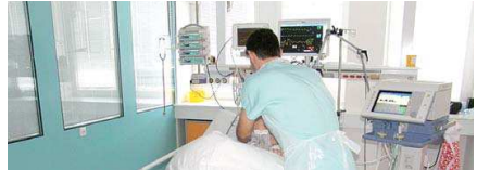
V KAŽDÉM BOXU je polohovatelné lůžko s vysoce kvalitní antidekubitální matrací a další přístroje.

Nové oddělení dlouhodobé intenzivní péče (DIP) s deseti lůžky a pěti lůžky s intenzivní ošetrovatelskou péčí (DIOP) v orlovské části nemocnice je vybaveno tou nejmodernějšími přístrojovými technikou a řadí se mezi jedna z nejlépe vybavených pracovišť v republice. Významnou investiční akcí financoval kraj částkou ve výši 70 milionů korun. V péči o vážně nemocné je kladen důraz na adekvátní výživu a také na bazální stimulaci u pacientů s poruchou vědo-