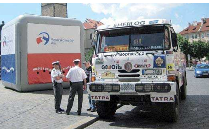
ZAJÍMAVÝ nápad se setkává s velkým ohlasem.

Moravskoslezský kraj vyrazil před letní turistickou sezónou na netradiční prezentaci akci, která je pojata jako série jednodenních road show na náměstích v českých a moravských městech – v Praze, Olomouci, Brně, Hradci Králové, Zlíně a Ostravě – za účasti známé osobnosti – několikrát známého vítěze Rallye Dakar Karla Lopraise a jeho legendární závodním speciálem Tatra. Představení kraje touto cestou se stalo s velkým ohlasem ze strany veřejnosti ve Zlíně, Brně a v Praze. Součástí show je představení kompletní nabídky jednotlivých šesti turistických oblastí kraje – k dispozici je celá řada propagačních materiálů, brožur a map zdarma. Celá prezentace je vždy dopl-