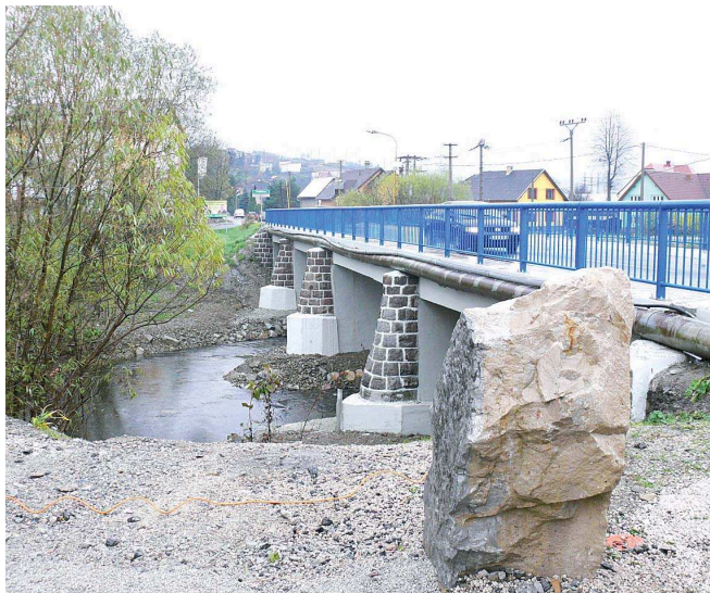
REKONSTRUOVANÉ silniční řísyky Bílá – Klokočov – Turzovka a Čadca – Milošová – Mosty u Jablunkova.

V období chronického nedostatku vlastních zdrojů se kraj snaží využít prostorů pro projekty, jež jsou financovatelné z evropských fondů. Evropské peníze se postupně staly hlavním zdrojem financování velkých krajských investic. Nejde v této souvislosti jen o dopravní stavby, jakými jsou například obchvat Opavy, revitalizace přednádražního prostoru ve Svinově nebo celé bloky mostních a silničních akcí 2010 či roku 2011.