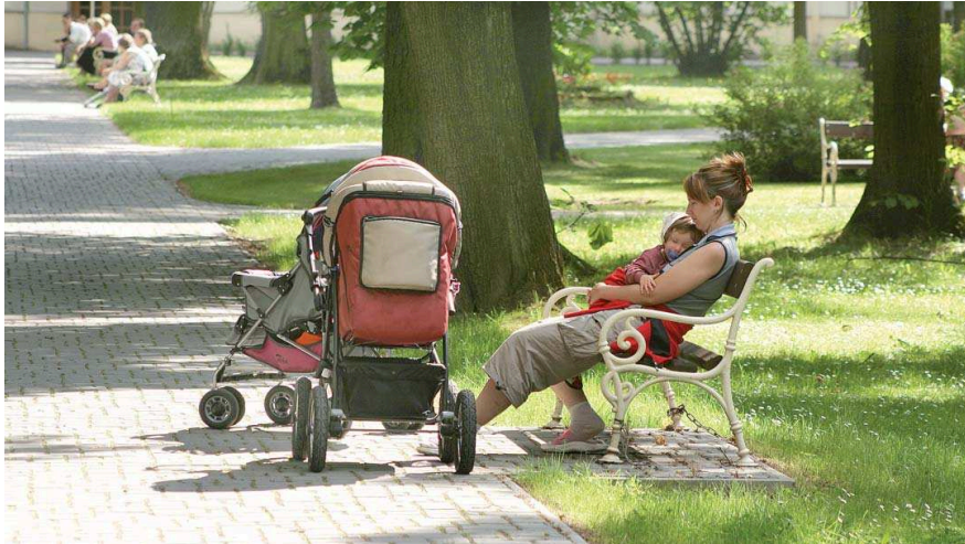
NEJHORŠÍ na centralizaci dávkových systémů je skutečnost, že povede k oslabení přístupu k lidem.

Z předložených návrhů je totiž zřejmé, že po přechodné období dvou let zůstanou pracovníci převedeni na Úřad práce ČR stále na obecních úřadech. Přitom ministerstvo práce a sociálních věcí slíbilo, že od ledna 2012 si dle většiny lidí všichni dávky u jednoho pracovníka. Nikdo však dosud netřel, jakým způsobem to úřad práce po dobu zmíněných dvou let zajistí. Cíli se jedná jen o formální změnu a není jasné, co se stane po uplynutí této doby, když v pěti obcích II. typu Moravskoslezského kraje nemá Úřad práce ČR žádnou svou pobočku. Buď se tak bude muset zřídit nový úřad, nebo lidé budou za vyřízení sociálních dávek dojíždět do jiného města. Rozsáhlý soubor změn dopadne přímo na potřeby lidí. Co se týká zdravotně postižených, má vzniknout zcela nový zákon pro poskytování