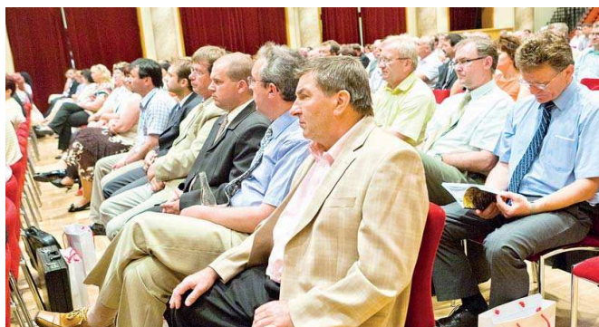
V ÚTERÝ 31. května 2011 se uskutečnilo tradiční setkání hejtmána Moravskoslezského kraje se starosty a primátory obcí a měst našeho kraje. Pracovní jednání bylo zaměřeno zejména na budování dopravní infrastruktury a fungování regionální veřejné dopravy do budoucna, optimalizaci sítě středních škol v kraji a úroveň veřejných služeb v našem regionu v návaznosti na připravovanou sociální reformu.

Při absenci dávek určených na bydlení by výše zmíněná matka neměla prostředky ani na úhradu nižších nákladů. Ide o praktickou ukázkou zásadní připomínky nejen našeho kraje, která nebyla vyslyšena. Takovému sankčnímu postupu v sociálních dávkách vůči lidem musí předcházet soubor opatření napříč jednotlivými resorty k řešení bytové otázky.