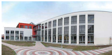
HLAVNÍ CENA v kategorii Rekonstrukce – stavební úpravy pracoviště Rejstříkova knihovny Karviná.