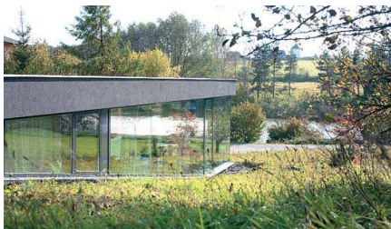
HLAVNÍ CENA v kategorii Rodinné domy – rodinný dům v Brušperku.