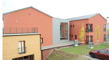
HLAVNÍ CENU v kategorii Bytové domy získal Dům s pečovatelskou službou v Ostravě-Porubí.

telské subjekty se sídlem v Moravskoslezském kraji a upozornit na architektonicky výrazné projekty, které se v kraji realizují. „O tuto soutěž je ze strany architektů, investorů, ale také jednotlivých vlastníků staveb velký zájem, neboť výsledky jsou sledovány nejen odborníky, ale také širokou veřejností, která se na hlasování může podílet. Dovedu si představit, jak je těžké z množství přihlášených staveb vybrat architektonicky a uživatelsky nejlepší,“ řekl hejtmán a dodal: „Jsme obklopeni vynikajícími stavbami a určité mnoho našich občanů zajímá, kdo je postavil a k čemu slouží.“ Na stanovení podmínek soutěže a na samotné organizaci se podílejí Svaz podnikatelů ve stavebnictví, Česká komora autorizovaných inženýrů a techniků, Obec architektů a Moravskoslezský kraj.