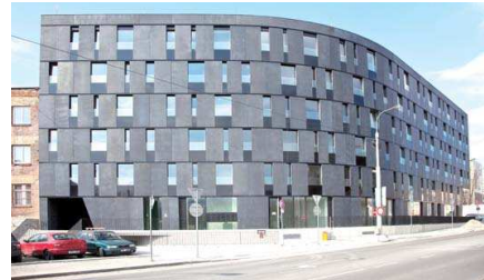
CENA odborné poroty za urbanismus – Ostravská brána.