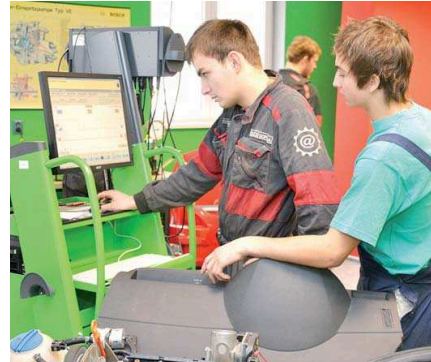
V BRUNTÁLE projevují studenti o novou techniku velký zájem.