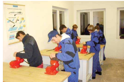
MODERNÍ VYBAVENÍ pomůže při náboru nových žáků v Albrechticích.

Před realizací projektu neměla Střední škola zemědělství a služeb