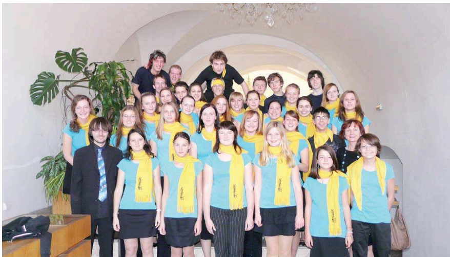
GARRENDO vyniklo mezi nejlepšími šestnácti sbory z celé republiky. Sbor si vyzpíval několik ocenění. Radost měli všichni členové i pedagogové.

V celostátním kole soutěže pro středněškolské sbory a sbory konzervatoří Opava Cantat 2011 dosáhli pěvecký sbor Garrendo několika významných úspěchů – vyzpíval si zlaté pásmo, získal