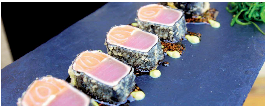
LOSOSOVO-TUŇÁKOVÁ ROLKA v řase nori s wasabi a omáčkou z černého sezamu – jeden z loňských pokrmů. Skvělé delikatesy budou k mání za festivalové ceny.

Také v našem kraji proběhne pod záštitou hejtmana Jaroslava Palase (ČSSD) oblíbený Grand restaurant festival, a to od 15. ledna do 15. února. Během jednoho měsíce ve všech krajích, dvaceti městech a více než 63 podnikcích mohou zájemci ochutnat skvělé delikatesy za festivalové ceny v restauracích, které získaly vysoké hodnocení v publikaci Maurerův Výběr Grand restaurant 2012. Partnerem projektu je agentura Czech-Tourism s projektem Czech Specials. Restaurace budou mít v rámci festivalu za úkol uvážit tři pokrmy – jídlo od maminky, specialitu šéfkuchaře a Czech Specials v podobě regionální speciality. K tomu, abyste se mohli zúčastnit kulinařského festivalu, musíte mít zakoupenou festivalovou ochutnávku ve vámi vybrané restauraci na příslušný den a čas. Vstupenky lze získat na www.grandrestaurantfestival.cz .