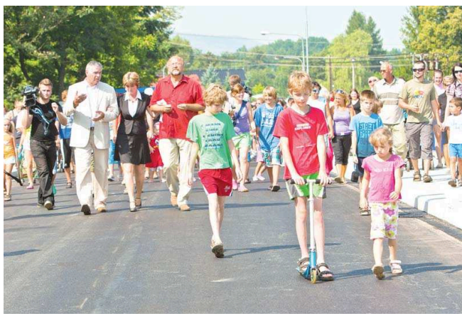
NAVŘENÁ konstrukce respektuje stávající komunikaci i potřebnou rezervu nad hladinou stoleté vody.

Původní starý most z roku 1961 byl 16. května 2010 zničen rozvodněnou Ostravicí. Řeka podlehla pilíř v korytě