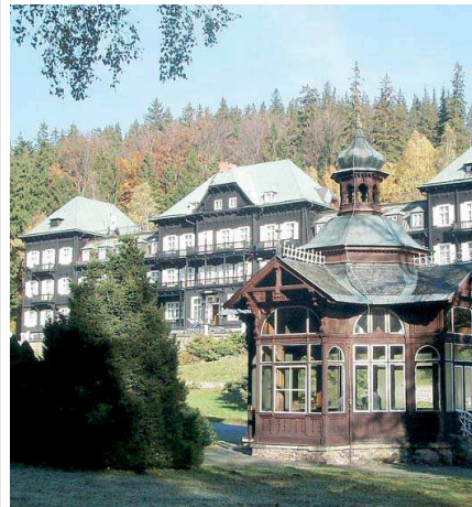
LÁZEŇSKÁ OBEC Karlova Studánka bezesporu patří k perlamům Jeseníků.

Jednou z nejkrásnějších oblastí Moravskoslezského kraje jsou Jeseníky s jejich „perlou“ Karlovou Studánkou. Právě na ně se soustřeďuje obsah reprezentativního časopisu s příznačným názvem Karlova Studánka a okolí. Jde o celobarevný magazín tištěný na křídlovém papíru s podtitulem Magazín pro příznivce Jeseníků. Časopis přináší zajímavé a užitečné informace z této atraktivní oblasti našeho regionu. Magazín je k dispozici zdarma nejen lázeňským hostům Karlovy Studánky, ale také dalším zájemcům. Kde ho najdete?