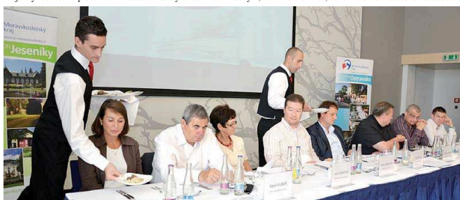
POROTA, sestavená z odborníků, zástupců KÚ MSK a médií, vybírala ty nejchutnější pokrmy.