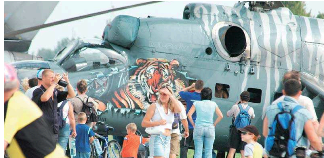
V AREÁLU se představí šestnáct zemí, některé ve své premiéře.

Jednu z velmi očekávaných premiér bude účast zřísavové jednotky německé celní správy Zentrale Unterstützungsgruppe Zoll (ZUZ). „Příslušníci celní ZUZ se představí v dynamické ukázkové spolu se svými českými kolegy ze speciální jednotky SON (Skupina operativního nasazení), tradičními účastníky akce, kteří každoročně sklízí aplaus