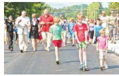
Baška se dočkala nového mostu strana 2