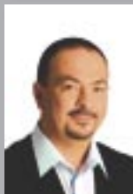
Pavol Lukša náměstek hejtmana kraje člen zastupitelstva a rady kraje KDU-ČSL

Zastupitelstvo mu svěřilo zabezpečování konkrétních úkolů na úsecích bezpečnosti, legislativy, zahraničních vztahů a financí.