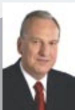
Ing. Evžen Tošenovský hejtman kraje člen zastupitelstva a rady kraje ODS

Zastupitelstvo mu svěřilo zabezpečování konkrétních úkolů na úsecích bezpečnosti, legislativy, zahraničních vztahů a financí.